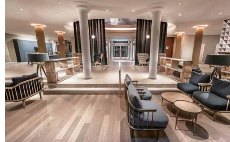
Die Blickachse in der Lobby, vom Eingang über die Lounge bis hin zur weitläufigen Terrasse und auf den Golfplatz, wird von zwei bodentiefen Vorhängen umrahmt. Das Farbschema ist natürlich und elegant.

Weitere Gastro-Bereiche sind die Treudelbar und das Restaurant Lemsahler. Beide konnten aufgrund der niedrigen Belegung im Mai noch nicht wiedereröffnen. Die Gestaltung ist wie im Rest des Hotels geprägt von vielen natürlichen Erd- und Holztönen, kombiniert mit maritimem