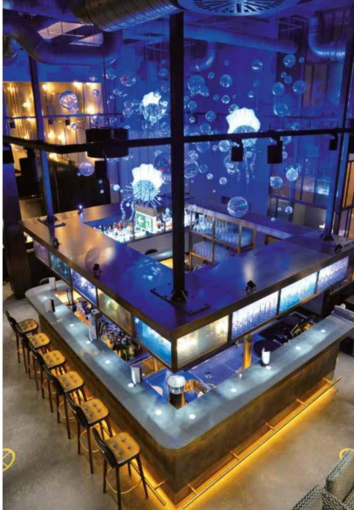
Über der Bar im Radisson Blu Senator Hotel in Lübeck schwimmen drei Quallen aus klaren Kristallperlen mit 90 cm langen Tentakeln durch ein Meer aus gläsernen Kugeln.

Investitionsstau gibt es bei Radisson nicht. Zumindest nicht in den Radisson-Blu-Häusern in Rostock und Lübeck. Dort werden laufend Modernisierungsmaßnahmen vorgenommen, zuletzt bekamen die Restaurants ein neues Antlitz. Licht spielte an beiden Standorten eine entscheidende Rolle.