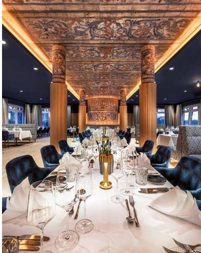
Nicht nur die Gäste im Restaurant Lemsahler geben sich dem leiblichen Wohle hin – auch die Putten im Deckengemälde widmen sich Genuss und Lebensfreude. Das Design versprüht historisches Flair, kombiniert mit maritimem Charme.

11 Monate und 16 Mio. Euro investierte das Steigenberger Hotel Treudelberg in Hamburg in seine Modernisierung. Das Ergebnis sind 131 stilvoll designte Zimmer und Suiten – klassisch und zurückhaltend – sowie öffentliche Bereiche im natürlichen, maritimen Look.