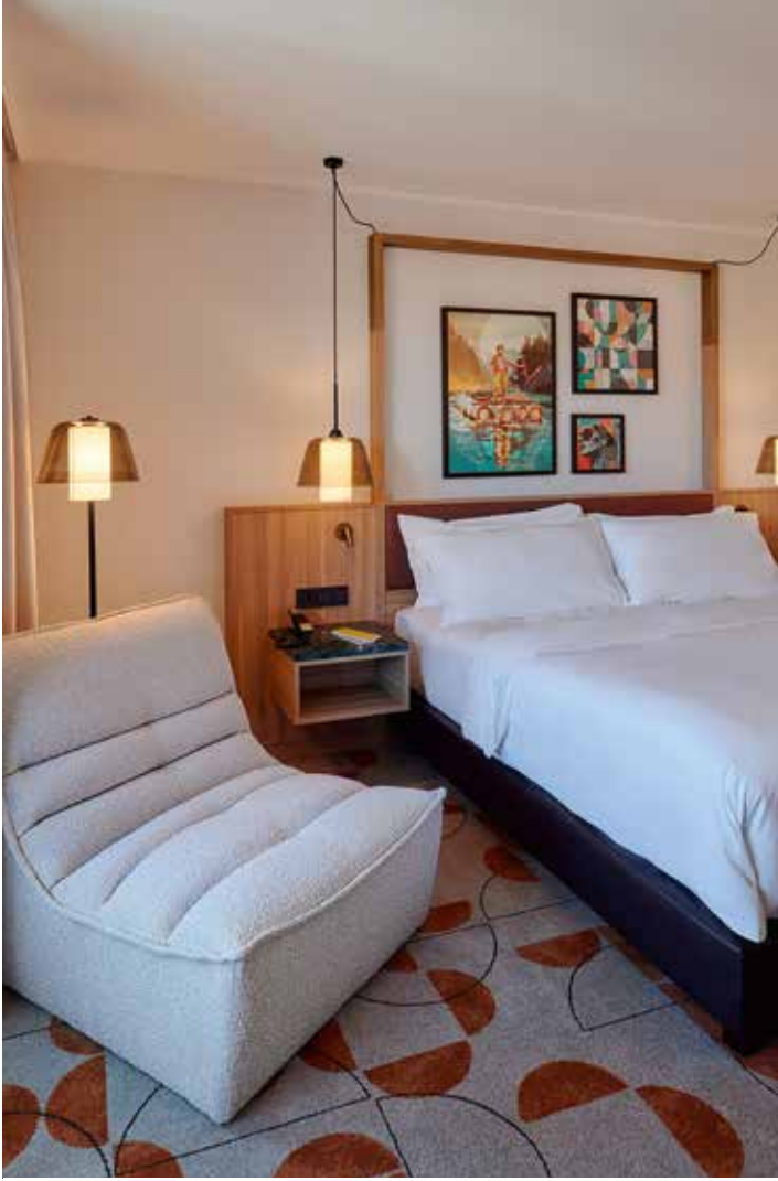
Flesslers Lenggries entdecken – das Design schafft Erlebnisse.